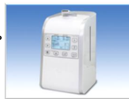
専用ミストファン