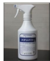
専用スプレーボトル

※遮光タイプのスプレーボトル。 ※注 次亜塩素酸水の新型コロナウイルスへの有効性 https://www.nite.go.jp/data/000111315.pdf